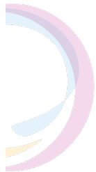
Bogen Farbe 20 %