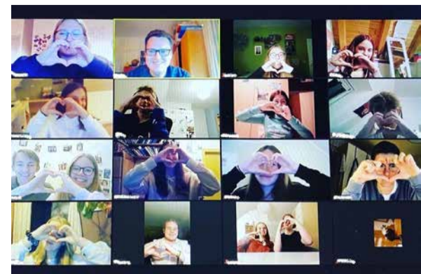
Unsere geliebte Evang. Jugend läuft online weiter.

Eine weitere große Chance dieser digitalen Jugendarbeit ist die Möglichkeit der einfachen Vernetzung und Kooperation. Digitale Music-Shows und Quiz-Abende konnten gemeinsam mit der Evangelischen Jugend im Dekanat Ingolstadt, dekanatsübergreifend, erfolgreich und sogar bayernweit stattfinden.