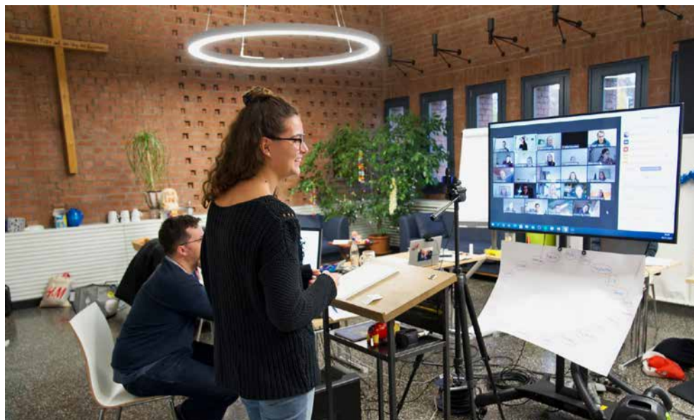
Es war schwer vorstellbar, aber der Grundkurs hat online geklappt.