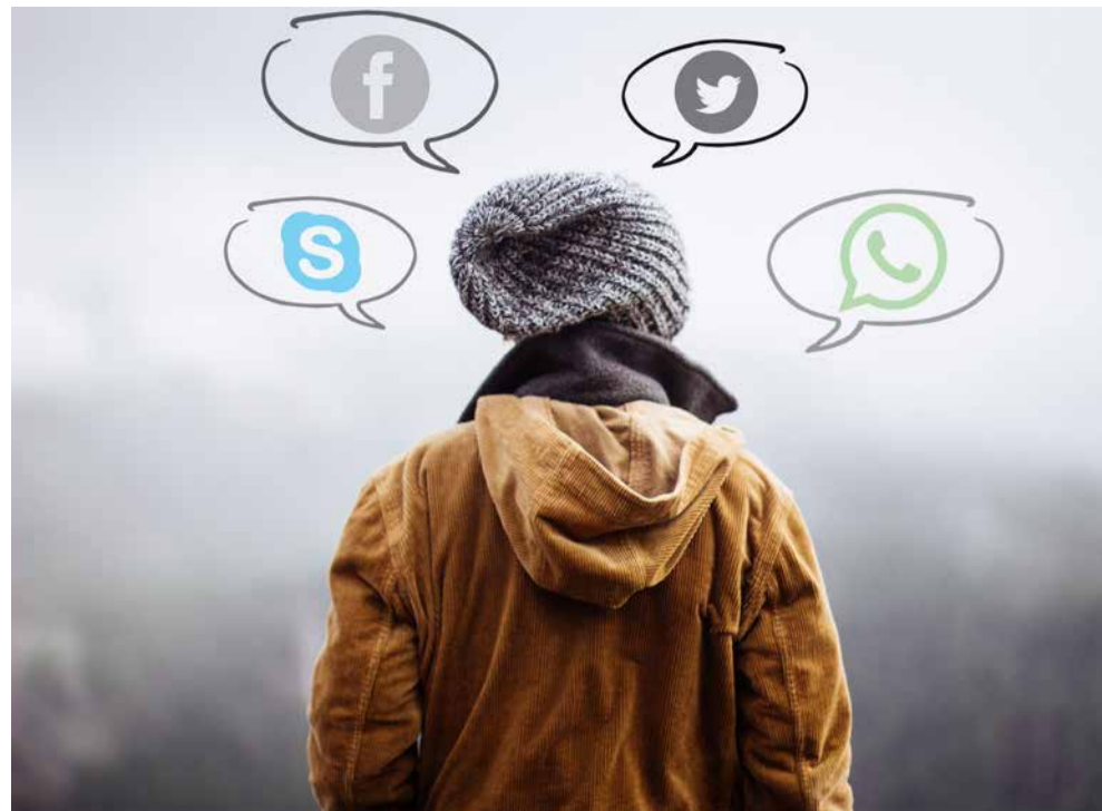
Jugendliche fühlen sich gegenwärtig nicht durch die Politik gehört.

ration unwiederbringlich verloren“, sagt Matthias Fack, Präsident des BJR. „Kinder und Jugendliche sind keine Objekte, die Schulen oder Kitas besuchen und dort betreut werden müssen.“ Er fordert die Politik dazu auf, dass sie als Menschen mit eigenständigen Bedürfnissen und Wünschen wahrgenommen werden. Die Mehrheit junger Menschen hat sich in der Corona-Pandemie solidarisch gezeigt und sich entgegen einer falschen öffentlichen Wahrnehmung an die Regeln gehalten. „Wir müssen jetzt jugendpolitisch agieren und die jungen Menschen ansprechen! Sie warten darauf, dass mit ihnen der Weg mit und aus der Pandemie gestaltet wird.“