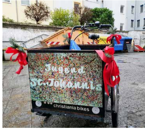
Verkündigung mit dem Lastenfahrrad.