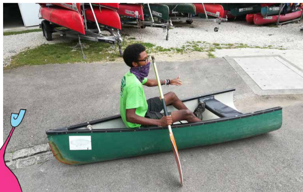
Es hat gedauert, bis wir die Formate online umsetzen konnten.

für mehrere Tage entwickelt. Dieses Logbuch wurde den Kindern zusammen mit kleinen Überraschungen nach Hause geschickt. Die Rückmeldungen der Eltern und Bilder der Kinder haben uns richtig angespornt, weiter kreativ zu werden. Nach „Mit Ejotti im Weltall“ und „Mit Ejotti auf Weltreise“ folgt in den Osterferien „Mit Ejotti auf Zeitreise“ das dritte Angebot dieser Art.