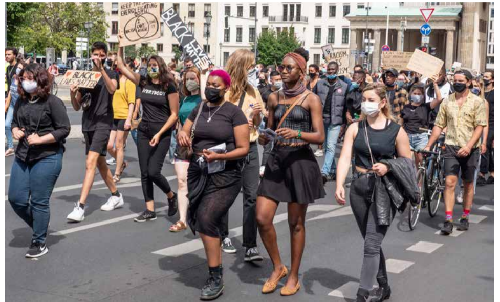
Demonstrieren gegen allgegenwärtigen Rassismus.

Aber stimmt das überhaupt? Ja, wir haben echt viele Sorgen und Baustellen – aber es gibt auch Dinge, die laufen richtig gut auf dieser Welt! Global können wir einige wichtige, richtige und langfristige Entwicklungen beobachten: Die globale Kindersterblichkeit sinkt beständig, die Demokratisierung ist auf dem Vormarsch und Bildung und Alphabetisierung schreiten stetig voran. Und sogar im letzten Jahr gab es einige sehr gute Entwicklungen, die hoffentlich anhalten werden: Hier kommen meine ganz persönlichen Top 3 Trends!