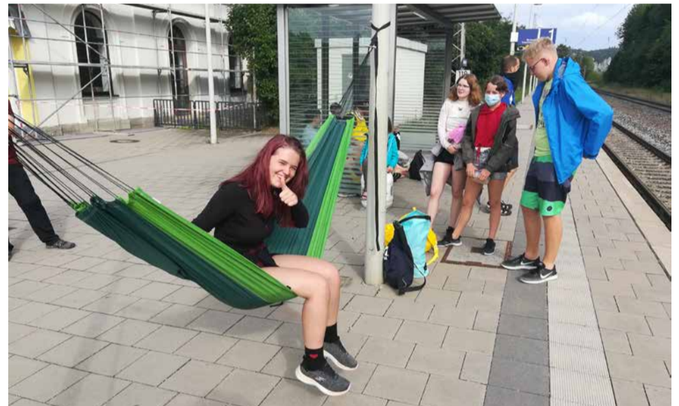
Jugendliche wollen Action und raus aus der Hängematte.

Was ich jetzt dringend bräuchte, wäre ein leichter Tritt in den Hintern und dann eine feste Umarmung.