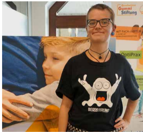
Bayerns beste Textilreinigerin (Jugendwerkstatt Kulmbach)

Das gilt auch für junge Menschen in der Arbeitsweltbezogenen Jugendsozialarbeit. Nur, dass für sie die Startlinie meist weit hinter den Startblöcken liegt, denn zu viele Voraussetzungen müssen sie während der Ausbildung erst noch erwerben: schulische Kenntnisse, Selbstvertrauen und Zuversicht, geeignete Wohnsituationen, positive Lernerfahrungen und vieles, vieles mehr. Auch den Lauf selber, die Ausbildung, malen wir uns nicht in leichter Sportkleidung und Spikes auf freier Tartanbahn aus. Um im Bild zu bleiben, stellen